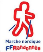
Marche nordique FFRandonnée

La Randonnée Pédestre : Licenciés sportifs, assurés en R.C, défense et recours, frais de recherches et de secours, accidents corporels et assistance.